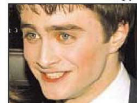
Daniel Radcliffe, o Harry Potter

• Daniel Radcliffe diz que está sentindo na pele as transformações da adolescência como seu personagem em "Harry Potter e o cálice de fogo", que estreia dia 25: "Essa coisa de hormônios não pára depois dos 14."