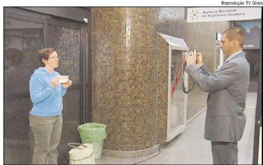
AMERICANA É fotografada em São Paulo: nos EUA, brasileiros serão fichados a partir de segunda