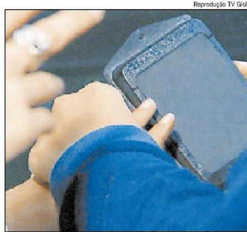
EQUIPAMENTO PARA tirar as digitais dos turistas americanos