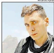
HEDI SLIMANE, da Dior, no Rio

• No Rio, o estilista Hedi Slimane, criador da Dior masculina, disse que fará moda feminina. É dele a roupa de casamento de Brad Pitt e a de Mick Jagger quando foi condecorado.