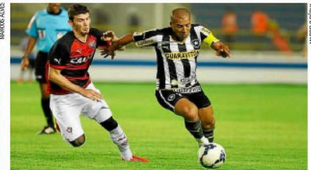
Mal. Emerson é marcado por jogador do Vitória: Botafogo na zona de rebaixamento