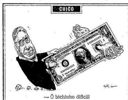
— O bichinho difícil

uma rádio por R$ 300 mil. A promessa dos dois candidatos de estender o abono de R$ 164,80 aos professores inativos foi realizada ontem pelo governador Marcello Alencar: "Já que eles desejam e estão prometendo fazer isso, decidi me antecipar", disse o governador. Páginas 3 a 5