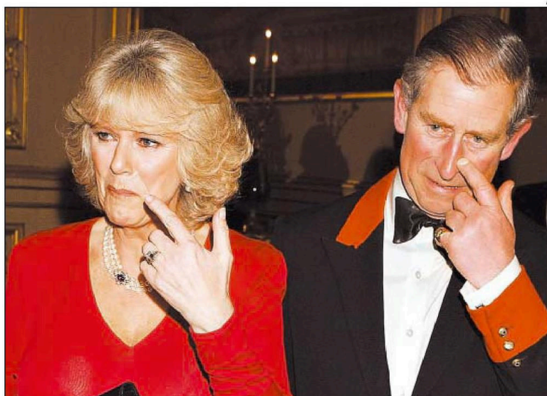
COM O ANEL de noivado, de platina e diamantes, Camilla chega ao Castelo de Windsor com Charles: príncipe disse que queria ser um tampax