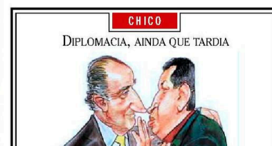
CHICO DIPLOMACIA, AINDA QUE TARDIA